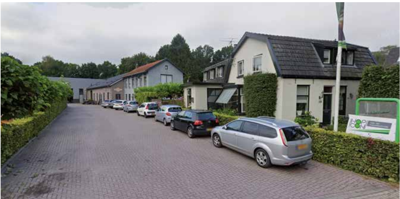
Het terrein van Hopcon

Al langere tijd zijn er gesprekken en onderhandelingen met de firma Hopcon Las- en Metaaltechniek over de aankoop van deze locatie. Hopcon draagt het bedrijvencomplex aan de Horsterweg over aan de gemeente, tegen een koopsom van € 1.6 miljoen. De gemeente