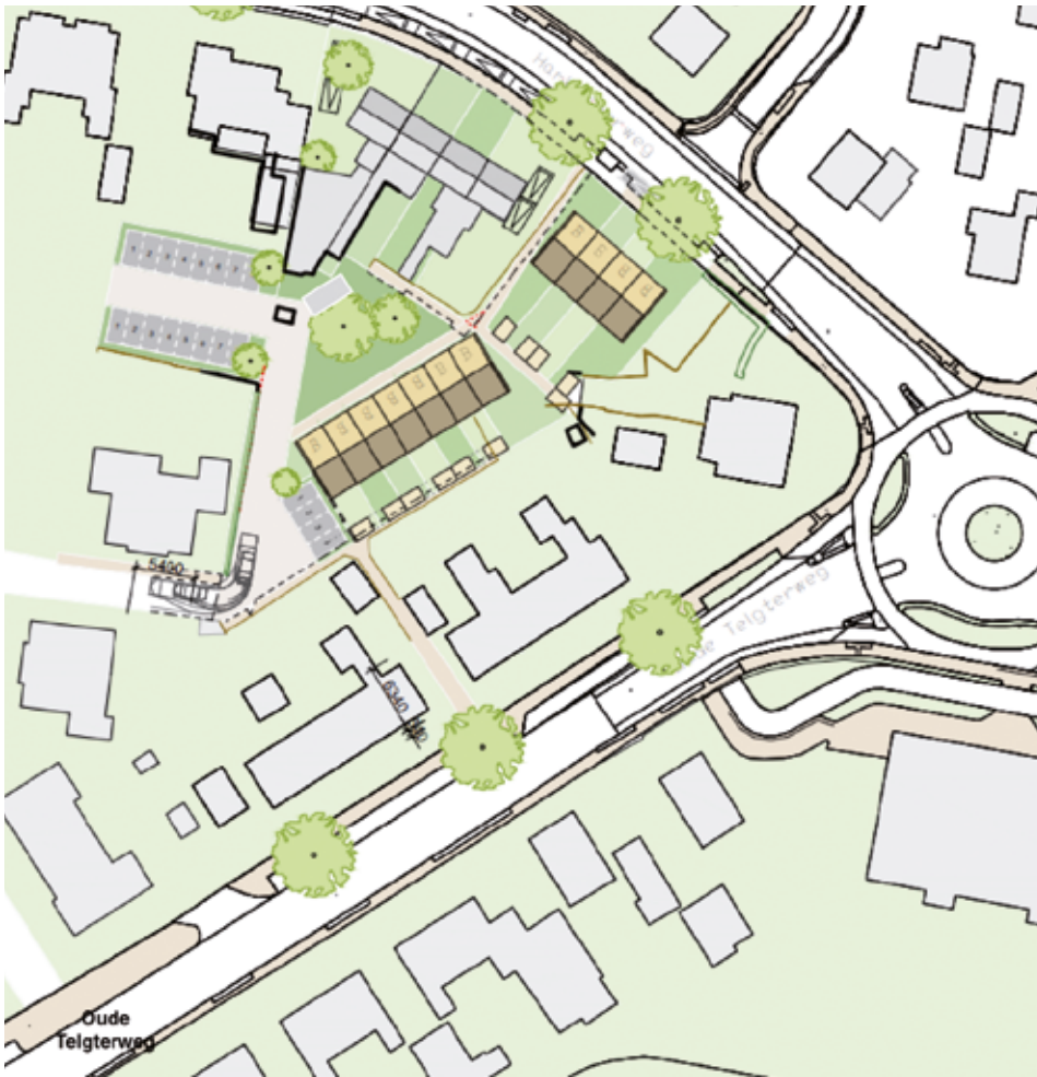
Plattegrond bouwlocatie Paulushof

Hamburgerweg mogelijk is. SGP-raadslid Pieter Stam diende daarom een motie (samen voorbereid met het CDA) in om een extern onafhankelijk verkeersonderzoek te laten uitvoeren naar de (on)mogelijkheden van ontsluiting op de Hamburgerweg, zodat de raad een afweging kan maken tussen beide ontsluitingsmogelijkheden, dit in relatie met het vastgestelde beleid. De totale kosten werden op €25.000,- geraamd, maar omdat er geen noodzaak is voor een kruispuntberekening of een simulatie werd dit verlaagd naar €15.000,-. Dit voorstel werd met algemene stemmen in de raad aangenomen. Het woningbouwplan wordt dus voorlopig aangehouden totdat de uitkomsten van het verkeersonderzoek bekend zijn.