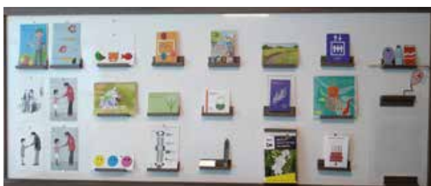
Voorbeelden van visuele hulpmiddelen

De CBB heeft inmiddels alle Nederlandse Bijbelvertalingen in braille uitgebracht. Ook zijn onder andere Hongaarse, Franse en Spaanse Bijbels in braille uitgegeven. Voor kinderen met een visuele beperking is er nu de Voelbare peuterbijbel met voorleespen. Zo kunnen deze kinderen samen met hun ouders acht Bijbelverhalen lezen: in braille, grootletter, audio en met voelbare afbeeldingen. Deze bewerking van Mijn kleine peuter-