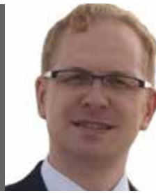
Tekst en foto: Pieter Stam