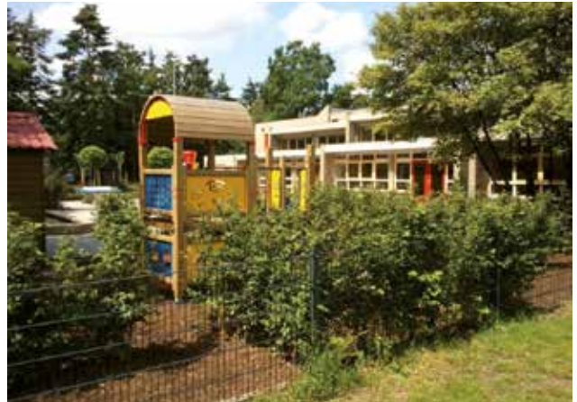
Augustinuschool Ermelo

Na zich in Thagaste een paar jaar in stilte met Bijbelstudie te hebben beziggehouden, werd Augustinus in 391 half tegen zijn wil tot priester gewijd en in 395 tot medebisschop van Hippo Regius het tegenwoordige Annaba in het Noordoosten van Algerije. Van 396 tot zijn dood in 430 was hij daar bisschop. Ook in die functie bleef hij een sober kloosterleven leiden in zijn bisschoppelijke woning.