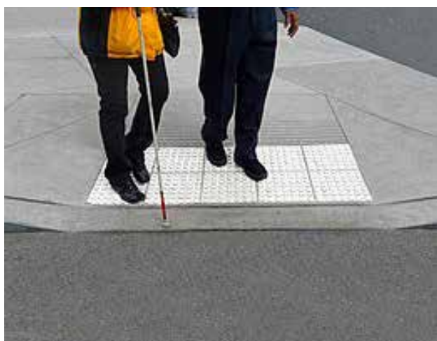
Wandelen met een blindenstok

De meeste van hen gebruiken een stok, taststok, een stok met of zonder rollerbal, het werkt als 'een voelspriet'. Een hulpmiddel om op straat obstakels te signaleren en de juiste route in te schatten, het is ook een herkenningsstok voor niet blinden. Zijn we ons daar als medeburgers wel van bewust?