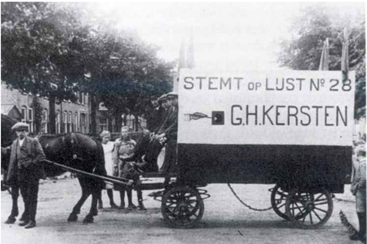
SGP-propaganda voor de Tweede Kamerverkiezingen van 1922.

parlement, ziet Kersten kansen voor zijn achterban. Te meer omdat hij de ARP en CHU niet principieel genoeg vindt.