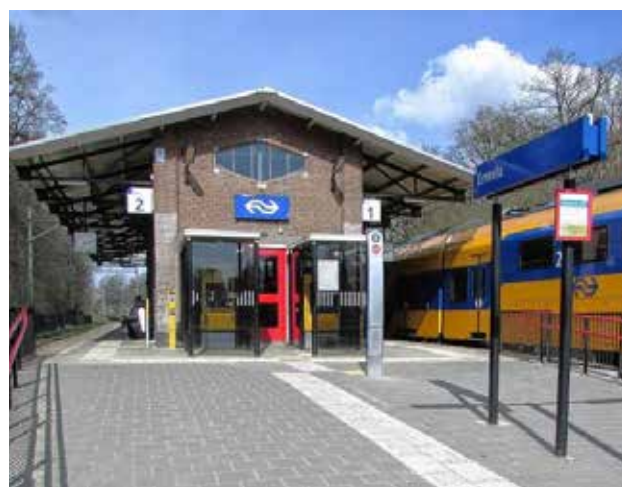
Geleidestrook station Ermelo

Laatst zag ik een jonge vrouw, met een taststok lopen, het voetpad smal, ze liep met haar stok tegen een heg, heel verrassend- ze glimlachte!