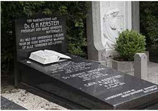
Graf van ds. G. H. Kersten

begraven op de begraafplaats Crooswijk in Rotterdam.