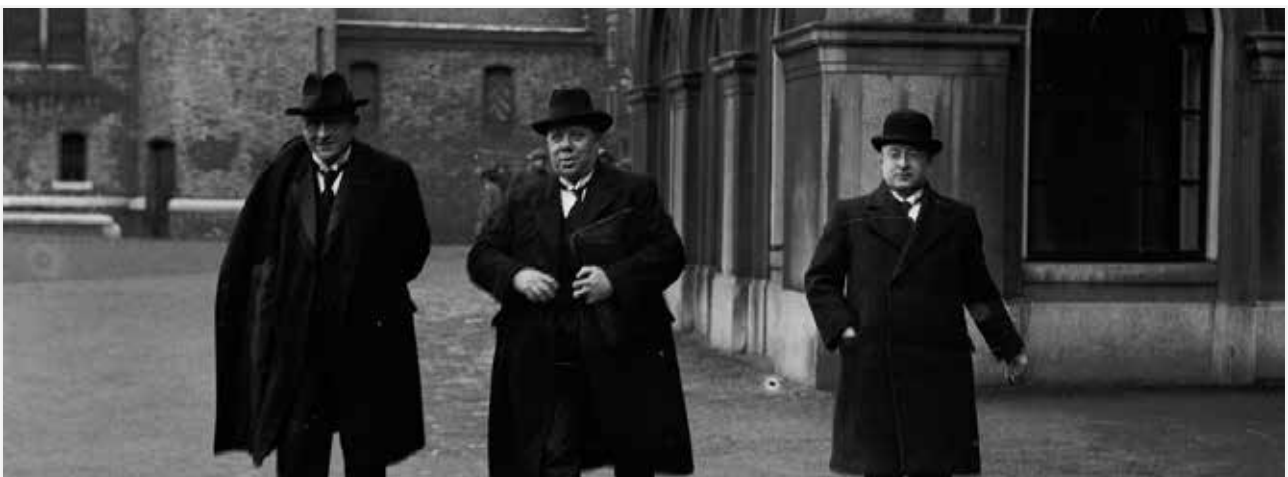
De SGP-fractie met in het middel Ds. Kersten in 1933 onderweg naar de vergaderzaal van de Tweede Kamer.

In de loop der jaren zijn enkele scholen (Yerseke, Borssele en Ridderkerk) en een schoolbegeleidingsdienst (Veenendaal) naar Ds. Kersten vernoemd. Ook verscheen zijn naam hier en daar in de openbare ruimte (een plein in Zwijndrecht, een laan in Gorinchem en een straat in Tholen, in het laatste geval met de letters DS in de postcode). Maar rond het Binnenhof is Ds. Kersten nog altijd persona non grata. Het Tweede Kamergebouw kent wel een Zandtkamer maar geen Kerstenzaal. Soms lijkt het verleden bewust verzwegen te moeten worden.