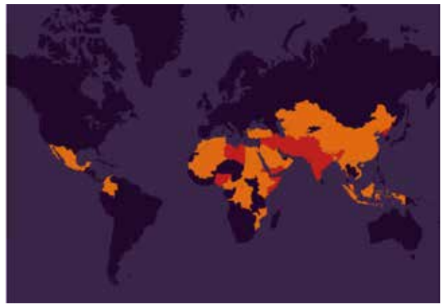
Landen van de Ranglijst christenvervolging