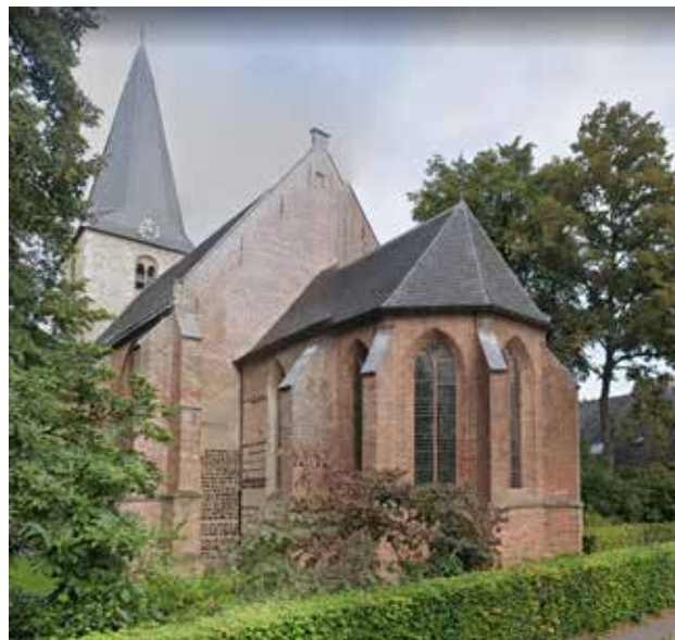
Ermelo, Oude Kerk

Een kerkenvisie is een strategische visie op de toekomst van kerkgebouwen. Ermelo kent verschillende oude monumentale kerkgebouwen. Gelukkig hebben we in