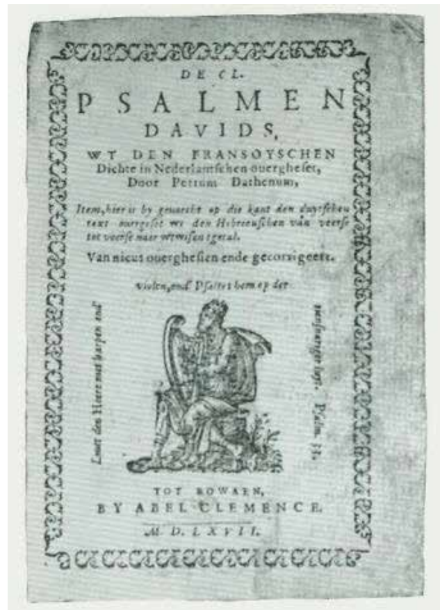
Titelblad van een psalmboek in de berijming van Datheen (foto onbekend)