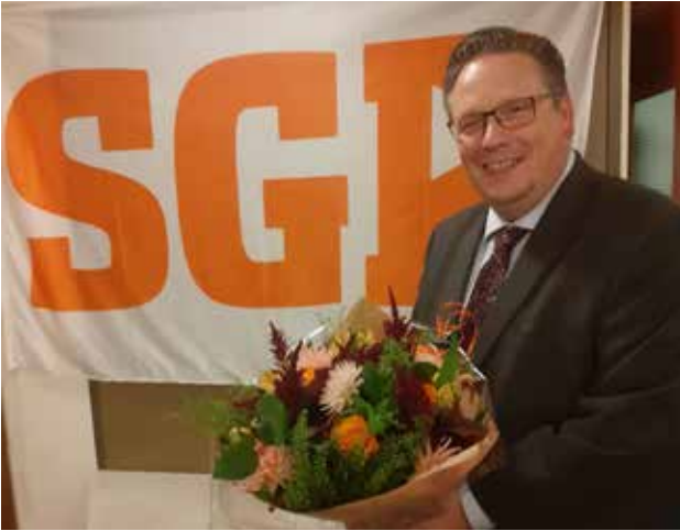
De net verkozen lijsttrekker met een fraai boeket bloemen.