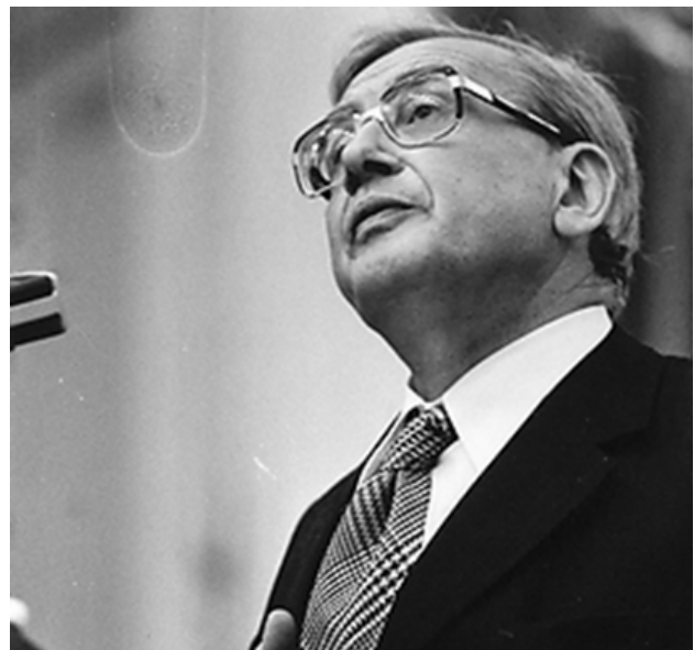
Als hij als Kamerlid sprak, richtte hij vaak de blik omhoog, het hoofd schuin achterover gebogen.

volksgezondheid. Hoewel hij vaak een minderheidsstandpunt innam, werd goed naar hem geluisterd, speciaal wanneer hij – de blik stevast schuin omhooggericht en de hand op de rechter revers van colbert of vest - op de ethische kanten van een onderwerp inging.